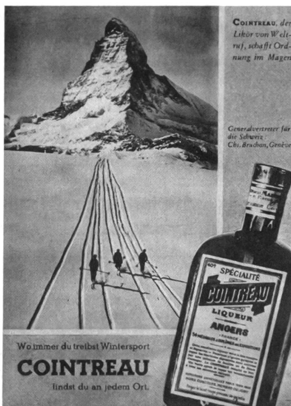
Fig. 2: Altro esempio d'estetica della traccia sulla neve. Pubblicità pubblicata sulla Zürcher Illustrierte Zeitung del 7 dicembre 1934.

per quanto riguarda lo sci (ma anche altri sport invernali, dal bob al curling), la competizione dà spettacolo e lo valorizza in quanto attrazione turistica. Questa congiuntura è sfruttata in modo esplicito dal celebre manifesto che Emil Cardinaux concepisce alla fine della prima guerra mondiale per la stazione di Davos. 36 Cardinaux disegna un gruppo di turisti che, installati su un palco in legno, osservano una corsa di bob tenendo gli sci in mano. In questo modo vengono rappresentate congiuntamente l'attività ricreativa e quella agonistica. Troviamo un funzionamento analogo nell'illustrazione del manifesto che annuncia l'ottava edizione della gara di sci militare e civile organizzata nel 1928 a Les Pléiades 37 : un concorrente in uniforme viene salutato da alcuni turisti con gli sci, che si recano sulle piste a bordo di un treno. In entrambi i casi si tratta di un'associazione che non sorprende se si pensa che molti concorsi sportivi sono organizzati anche per promuovere le località di montagna come meta turistica.