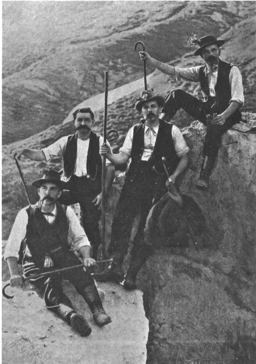
Abb. 3: Alpinspektion im Gebiet der Korporation Uri mit Vertretern von Korporation, Kanton und anderen lokalen Organisationen.