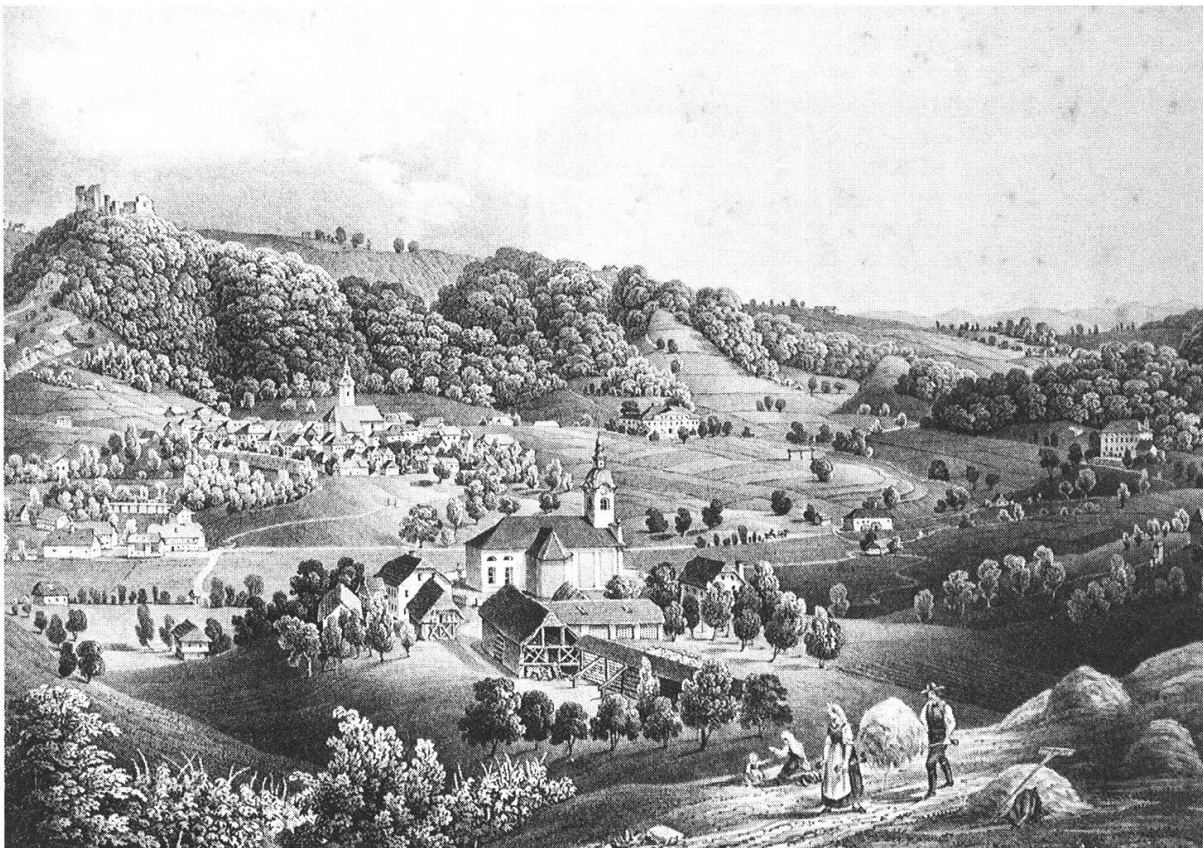
Abb. 1: Bei der Heuernte in Weixelburg (Višna Gora, Krain), Joseph Wagner, Malerische Ansichten aus Krain, nach der Natur gezeichnet und lithographiert, Klagenfurt 1842.

In Summe wirkte sich die Dominanz des Klein- und Kleinstbauerntums auf die Arbeitsgegebenheiten und -prozesse aus. 22 In der Regel bewirtschafteten die Bauern mit ihrer Familie und dem Gesinde Grund und Boden. Noch immer spielten sich die Arbeitsprozesse im traditionellen Rahmen ab. Ein mechanisiertes Arbeiten fand nur partiell auf grösseren Grundherrschaften oder Bauernhöfen statt. Daher erforderte der intensive Feldbau noch im frühen 19. Jahrhundert eine entsprechende Anzahl von Arbeitskräften. Das Aussäen und Ernten auf den Feldern erfolgte vornehmlich noch mittels Handarbeit. 23 Nur zögerlich wurde Arbeitskraft sparendes Gerät wie etwa der «Zugmayersche Pflug» oder die Mähseuse verwendet. Man setzte noch immer auf die menschliche Arbeitskraft und hielt an den alten, arbeitsaufwändigen Produktionsformen fest. In den südlichen Teilen Kärntens halfen mangels einheimischer Arbeitskräfte «Schoberschnitter» beziehungsweise «Taglohnschnitter» aus dem angrenzenden Krain aus. Der Getreideschnitt war noch immer ein äusserst personalintensiver Vorgang. Erst als «die fleissigen und bewerbsamen Krainerinnen, die sonst zahlreich zum Getreideschnitte nach Kärnten kamen und hier gut aushalfen, immer sparsamer erschienen», 24 gingen die grundherrschaftlichen und – eher