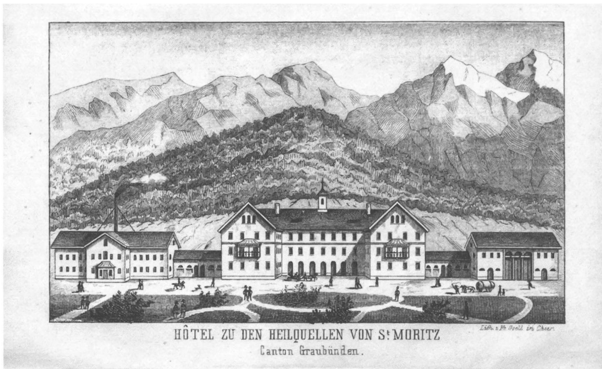
Abb. 2. Ansicht des Kurhauses St. Moritz aus G. Mosmann, Die Bestandteile, Wirkung und Gebrauch der Mineralquellen von St. Moritz im Oberengadin , Chur 1856.

gleichzeitig einen Beitrag zur Diskussion um die möglichst effiziente Abfüllung von Quellwässern zum Versand. Georg Mosmann wiederum entwickelte 1858 im Auftrag der Heilquellengesellschaft eine Instruktion zur korrekten Flaschenfüllung des St. Moritzer Wassers. 36