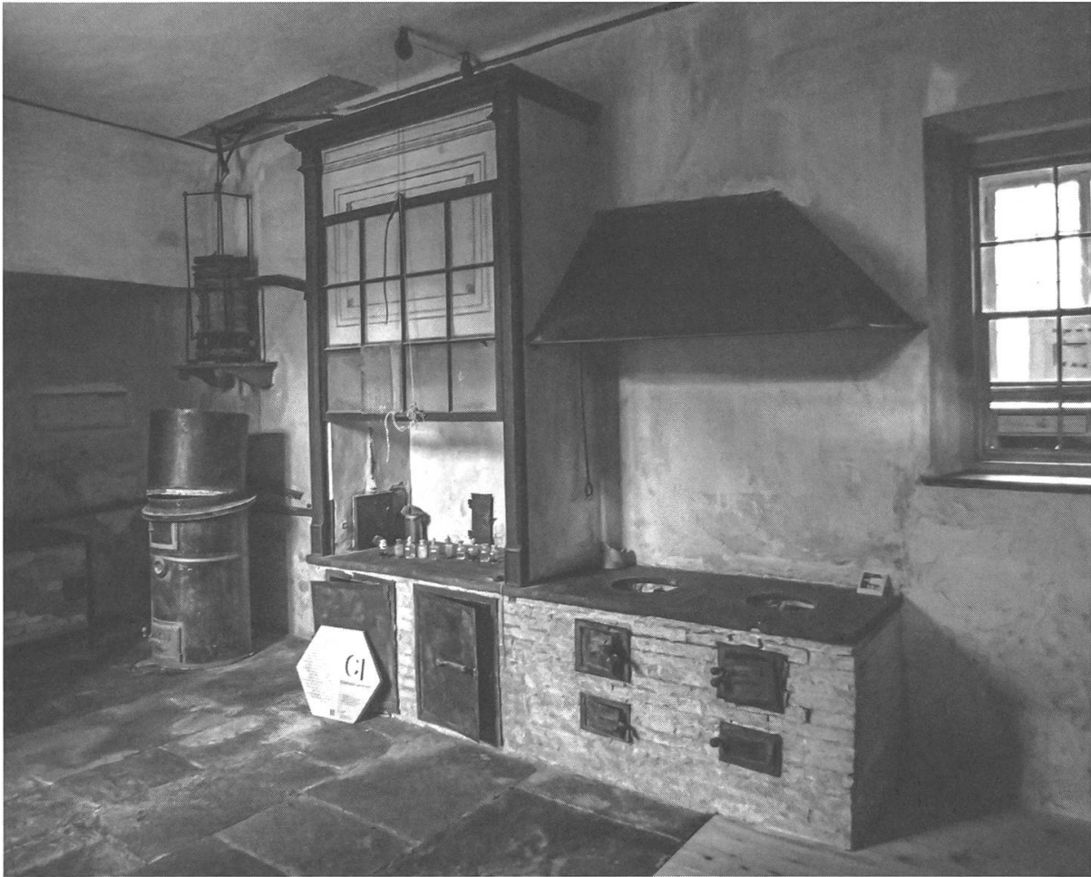
Abb. 1. Das Labor des Chemikers Adolf von Planta-Reichenau auf Schloss Reichenau.

sche oder botanische Ausführungen hinzu und führte auch medizinische Indikationen der Quellwässer an. Oft verband er diese Information mit seinen guten Wünschen für den wirtschaftlichen Erfolg der Kurorte. 34