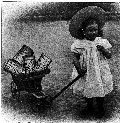
Galactina für das Brüderchen.

Einen grossen Fehler begehen diejenigen Mütter, die ihre Kinder einzig mit Kuhmilch auferziehen, da bekanntlich der besten Kuhmilch die Knochen und Muskel bildenden Bestandteile fehlen. Vom dritten bis zum zwölften Monate benötigt ein jedes Kind eine Beinahrung. Man gebe ihm daher dreimal täglich, zuerst in der Saugflasche, später als Brei, das vorzügliche, zur Hälfte aus Alpenmilch bestehende