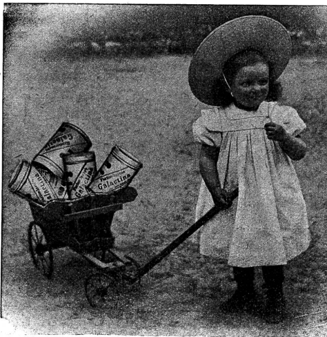
Galactina für das Brüderchen.

Einen grossen Fehler begehen diejenigen Mütter, die ihre Kinder einzig mit Kuhmilch auferziehen, da bekanntlich der besten Kuhmilch die Knochen und Muskel bildenden Bestandteile fehlen. Vom dritten bis zum zwölften Monate benötigt ein jedes Kind eine Beinahrung. Man gebe ihm daher dreimal täglich, zuerst in der Saugflasche, später als Brei, das vorzügliche, zur Hälfte aus Alpenmilch bestehende