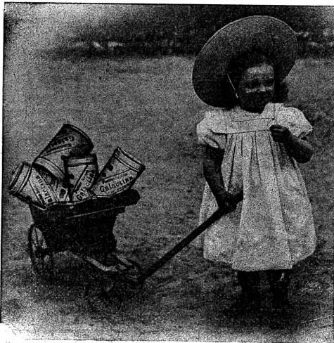
Galactina für das Brüderchen.

Einen grossen Fehler begehen diejenigen Mütter, die ihre Kinder einzig mit Kuhmilch auferziehen, da bekanntlich der besten Kuhmilch die Knochen und Muskel bildenden Bestandteile fehlen. Vom dritten bis zum zwölften Monate benötigt ein jedes Kind eine Beinahrung. Man gebe ihm daher dreimal täglich, zuerst in der Saugflasche, später als Brei, das vorzügliche, zur Hälfte aus Alpenmilch bestehende