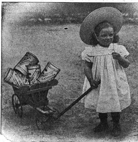
Galactina für das Bräderchen.

Kinderkrippe Winterthur schreibt: Ihr Kindermehl wird in unserer Anstalt seit 1½ Jahren verwendet und zwar mit bestem Erfolg. Die mit Galactina genährten Kinder gedeihen vorzüglich und da wo Milch nicht vertragen wird, leistet Galactina uns in den meisten Fällen bessere Dienste als Schleim.