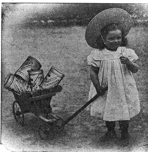
Galactina für das Brucerchen.

Kinderkrippe Winterthur schreibt: Ihr Kindermehl wird in unserer Anstalt seit 1 1/2 Jahren verwendet und zwar mit bestem Erfolg. Die mit Galactina genährten Kinder gedeihen vorzüglich und da wo Milch nicht vertragen wird, leistet Galactina uns in den meisten Fällen bessere Dienste als Schleim.