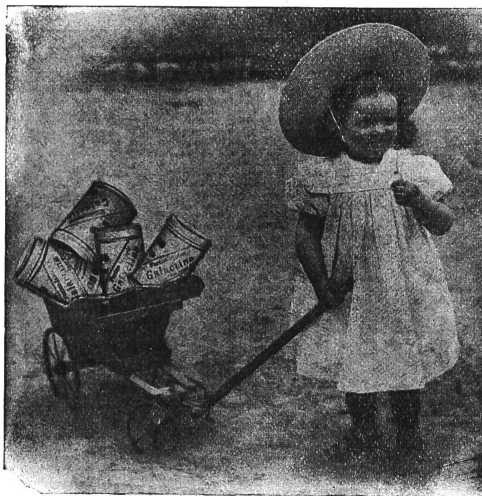
Galactina für das Bräuerchen.

Kinderkrippe Winterthur schreibt: Ihr Kindermehl wird in unserer Anstalt seit 1 1/2 Jahren verwendet und zwar mit bestem Erfolg. Die mit Galactina genährten Kinder gedeihen vorzüglich und da wo Milch nicht vertragen wird, leistet Galactina uns in den meisten Fällen bessere Dienste als Schleim.