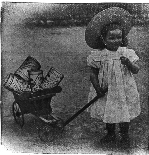
Galactina für das Brüderchen

Länggasskrippe Bern schreibt: Wir verwenden seit Jahren Galactina in allen Fällen, wo Milch nicht vertragen wird; selbst bei ganz kleinen Kindern hat sich in Krankheitsfällen Galactina als lebensrettend bewährt. Sehr wertvoll ist Galactina in Zeiten, wo nasses Gras gefüttert wird, auch während der grössten Hitze, wo trotz aller Sorgfalt die Milch sehr rasch verdirbt.