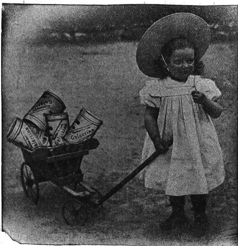
Galactina für das Bräuerchen

Kinderkrippe Winterthur schreibt: Ihr Kindermeihl wird in unserer Anstalt seit 1 \frac{1}{2} Jahren verwendet und zwar mit bestem Erfolg. Die mit Galactina genährten Kinder gedeihen vorzüglich und da wo Milch nicht vertragen wird, leistet Galactina uns in den meisten Fällen bessere Dienste als Schlem.