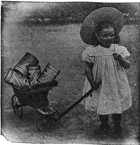
Galactina für das Brüderchen

Länggasskrippe Bern schreibt: Wir verwenden seit Jahren Galactina in allen Fällen, wo Milch nicht vertragen wird; selbst bei ganz kleinen Kindern hat sich in Krankheitsfällen Galactina als lebensrettend bewährt. Sehr wertvoll ist Galactina in Zeiten, wo nasses Gras gefüttert wird, auch während der grössten Hitze, wo trotz aller Sorgfalt die Milch sehr rasch verdirbt.