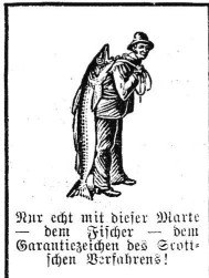
Nur echt mit dieser Marke dem Fische — dem Garantiefischen des Scott'schen Verfahrens!

Zu Versuchszwecken liefern wir Hebammen gerne 1 große Probeflasche umsonst und postfrei. Wir bitten, bei deren Bestellung auf diese Zeitung Bezug zu nehmen Räuflich in 1/4 und 1/2 Flaschen zu Fr. 5.— und Fr. 2.50.