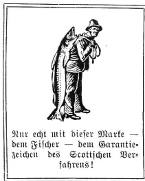
Nur echt mit dieser Marke — dem Fischer — dem Garantiezeichen des Scottischen Verfahrens!

Während der Schwangerschaft, im Wochenbett und beim Stillen unterstützt der ständige Gebrauch von Scotts Emulsion die Ernährung des durch den vermehrten Stoffverbrauch größere Nährmengen erfordernden Körpers in nachhaltiger Weise.