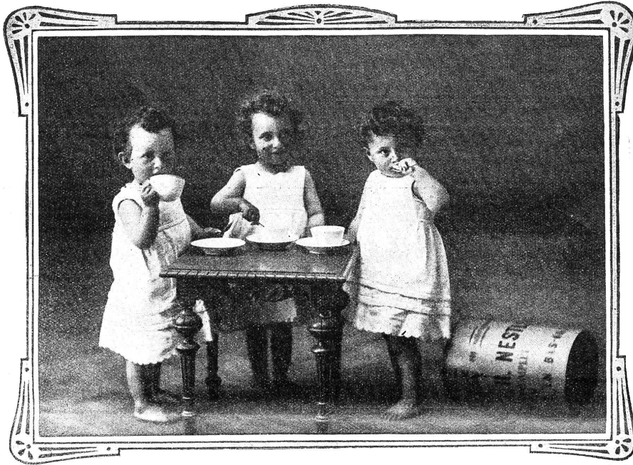
VEVEY, 10. Juli 1909.

Ich sende Ihnen unter aufrichtigster Dankesbezeugung die Photographie meiner Drillingsknaben, welche durch Nestlé's Kindermehl gerettet wurden.