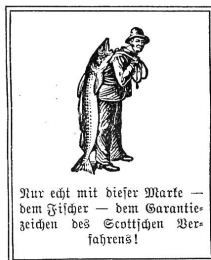
Nur echt mit dieser Marke — dem Fische — dem Garantiezeichen des Scottischen Verfahrens!

Während der Schwangerschaft, im Wochenbett und beim Stillen unterstützt der ständige Gebrauch von Scotts Emulsion die Ernährung des durch den vermehrten Stoffverbrauch größere Nährmengen erfordernden Körpers in nachhaltiger Weise.