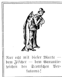
Nur echt mit dieser Marke — dem Fischer — dem Garantiezeichen des Scott'schen Verfabrens!

Während der Schwangerschaft, im Wochenbett und beim Stillen unterstützt der ständige Gebrauch von Scotts Emulsion die Ernährung des durch den vermehrten Stoffverbrauch größere Nahrungsmengen erfordern Körpers in nachhaltiger Weise.