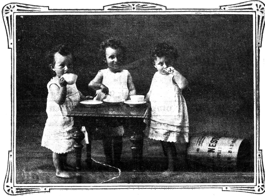
VEVEY, 10. Juli 1909.

Ich sende Ihnen unter aufrichtigster Dankesbezeugung die Photographie meiner Drillingsknaben, welche durch Nestlé's Kindermehl gerettet wurden.