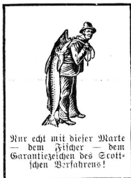
Nur echt mit dieser Marke — dem Fische — dem Garantiezeichen des Scotts- schen Verfahrens!

erreichen läßt. Sie erhält die stillende Mutter bei Kräften, ist leicht verdaulich, wohl- bekömmlich und bereichert das Blut, so daß bald eine rasche Kräftezunahme bewirkt wird.