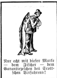
Nur echt mit dieser Marke — dem Fische — dem Garantiezeichen des Scott'schen Verfahrens!

erreichen läßt. Sie erhält die stillende Mutter bei Krämpfen, ist leicht verdaulich, wohlbekömmlich und bereichert das Blut, so daß bald eine rasche Kräftezunahme bewirkt wird.