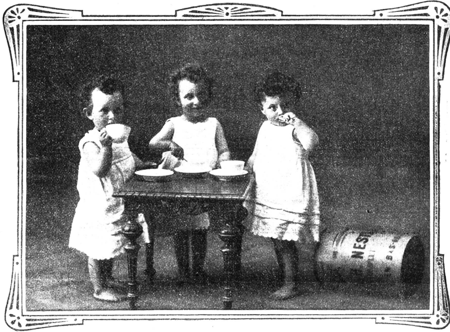
VEVEY, 10. Juli 1909.

Ich sende Ihnen unter aufrichtigster Dankesbezeugung die Photographie meiner Drillingsknaben, welche durch Nestlé's Kindermehl gerettet wurden.