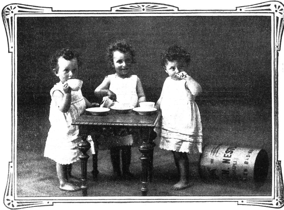
VEVEY, 10. Juli 1909.

Ich sende Ihnen unter aufrichtigster Dankesbezeugung die Photographie meiner Drillingsknaben, welche durch Nestlé's Kindermehl gerettet wurden.