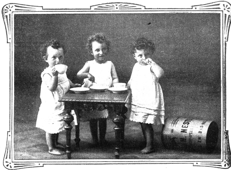
VEVEY, 10. Juli 1909.

Ich sende Ihnen unter aufrichtigster Dankesbezeugung die Photographie meiner Drillingsknaben, welche durch Nestlé's Kindermehl gerettet wurden.