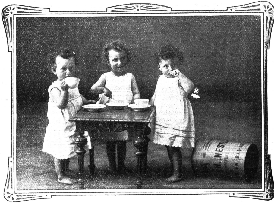
VEVEY, 10. Juli 1909.

Ich sende Ihnen unter aufrichtigster Dankesbezeugung die Photographie meiner Drillingsknaben, welche durch Nestlé's Kindermehl gerettet wurden.