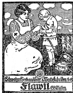
Schweizer Verbandstoff- u. Wollfabrik A.G. Flawil St. Gallen

Lehmann-Brandenberg, Sanitätsgeschäft, Bern, Liebegg.