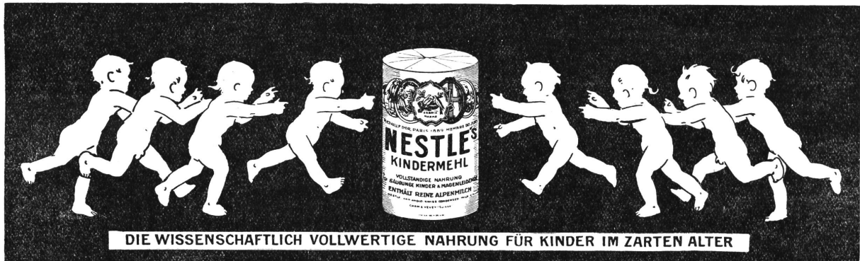
DIE WISSENSCHAFTLICH VOLLWERTIGE NAHRUNG FÜR KINDER IM ZARTEN ALTER