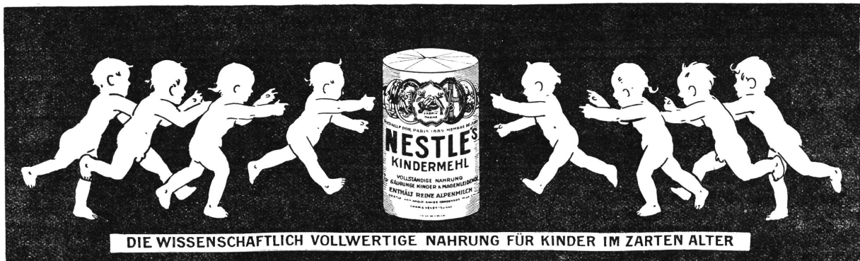
DIE WISSENSCHAFTLICH VOLLWERTIGE NAHRUNG FÜR KINDER IM ZARTEN ALTER