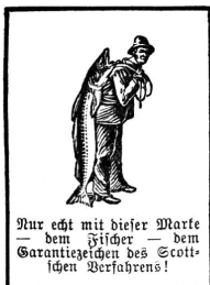
Nur echt mit dieser Marke — dem Fische — dem Garantzeichen des Scott'schen Verfahrens!

erreichen läßt. Sie erhält die stillende Mutter bei Kräften, ist leicht verdaulich, wohlbeiförmlich und bereichert das Blut, so daß bald eine reiche Kräftezunahme bewirkt wird.