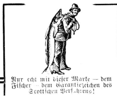
Nur echt mit dieser Marke — dem Bilde — dem Warenzeichen des Scotts Emulsion!

Käuflich in ¼ und ½ Flaschen zu Fr. 6.— und Fr. 3.—