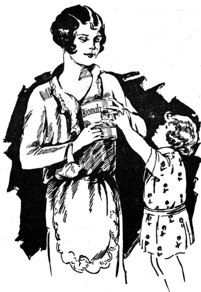
In Dosen zu 600 gr Inhalt Fr. 3.50 In Dosen mit dem halben Inhalt Fr. 2.—

10. Als Ort der nächsten Delegierten- und Generalversammlung wird ebenfalls gemäß Be-