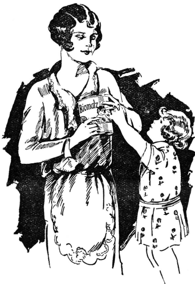
In Dosen zu 600 gr Inhalt Fr. 3.50 In Dosen mit dem halben Inhalt Fr. 2.—