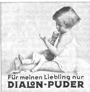
Für meinen Liebling nur DIALON-PUDER