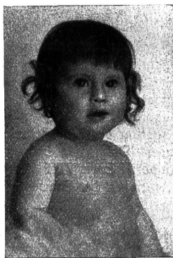
Das gleiche Kind genau 4 Monate später