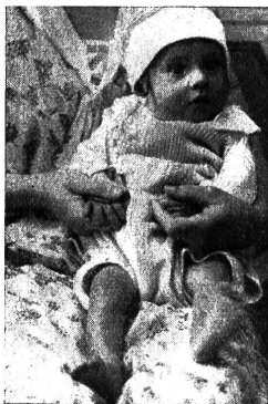
Rachitisches Kind genau 6 Monate alt