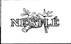
Für die Schleimzubereitung

AKTIENGESELLSCHAFT FÜR NESTLÉ PRODUKTE, VEVEY