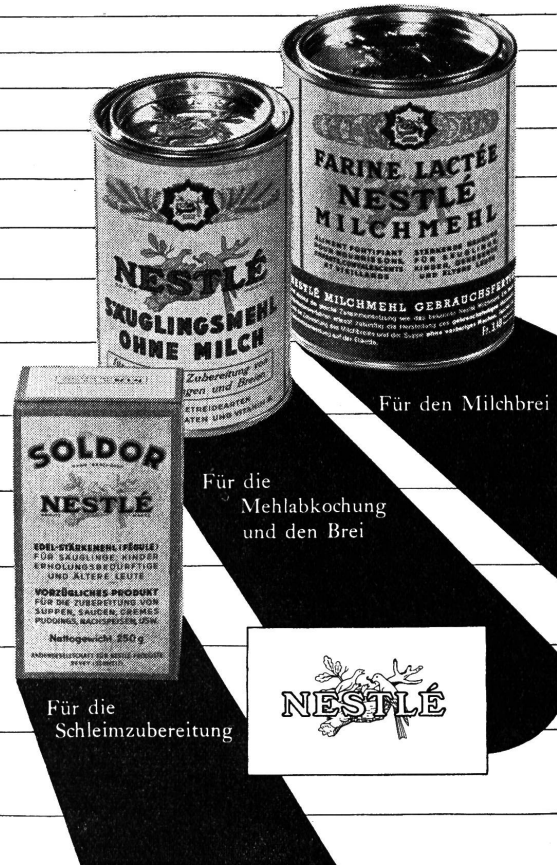
Für den Milchbrei

Diese drei Nestlé Spezialitäten erleichtern eine abgestufte Einführung der Stärke und hierauf der Mehle beim Säugling und grösseren Kinde.