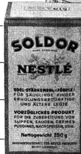
Für die Schleimzubereitung