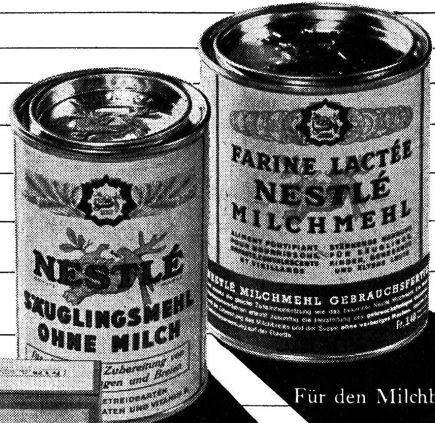
Für den Milchbrei

Diese drei Nestlé Spezialitäten erleichtern eine abgestufte Einführung der Stärke und hierauf der Mehle beim Säugling und grösseren Kinde.