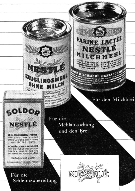
Für den Milchbrei

Diese drei Nestlé Spezialitäten erleichtern eine abgestufte Einführung der Stärke und hierauf der Mehle beim Säugling und grösseren Kinde.