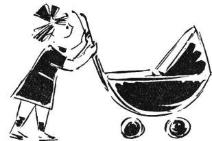
Bedeutet eine zum Wachstum notwendige Bereicherung der Säuglingskost

GUIGOZ S. A. 2 Guigoz 2 VUADENS (Gruyère) NÄHRMITTEL MILCHMEHL