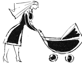
Milchmehl aus Guigoz-Milch, Zwieback, Zucker und Phosphaten