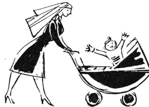
Der ideale Zusatz zur Guigoz-Milch vom 4. Monat an