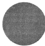
Frischgekochter Haferschleim nach Vorschrift zubereitet: Kein Bakterienwachstum feststellbar