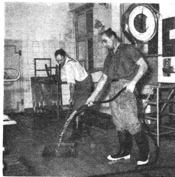
Um 16 Uhr werden Fabrikationslokale und Maschinen täglich mit Heißwasser ausgewaschen. Arbeiter der Nachtschicht müssen die Fabrikationsräume ein zweites Mal schrubben, die Maschinen auseinandernehmen, reinigen, wieder montieren und mit Dampf sterilisieren. Morgens, bei der Ablieferung der Milch, ist alles rein und steril.