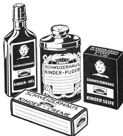
Dr. Gubser-Knoch AG. Schweizerhaus, Glarus zuverlässige Heil- und Vorbeugungsmittel für die Pflege des Säuglings und des Kleinkindes. Tausendfach erprobt und bewährt.

getan werden, um die Kinder möglichst aktiv am Leben teilnehmen zu lassen und um ihre Pflege zu erleichtern. Dabei muß man verschieden vorgehen in den einzelnen Stadien der Krankheit.