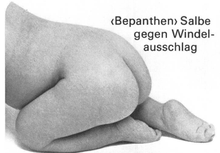
«Bepanthen» Salbe gegen Windel- ausschlag