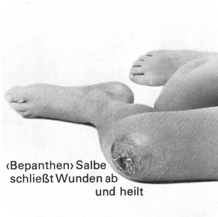
«Bepanthen» Salbe schließt Wunden ab und heilt