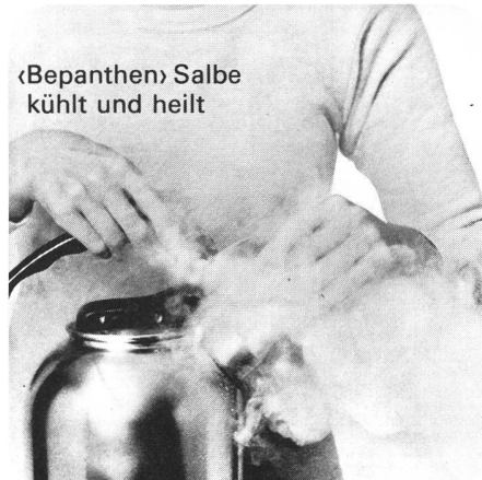
«Bepanthen» Salbe kühlt und heilt