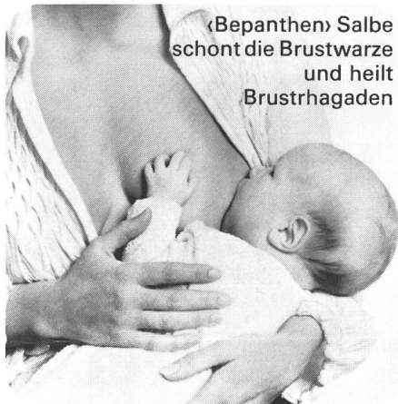
«Bepanthen» Salbe schont die Brustwarze und heilt Brustrhagaden