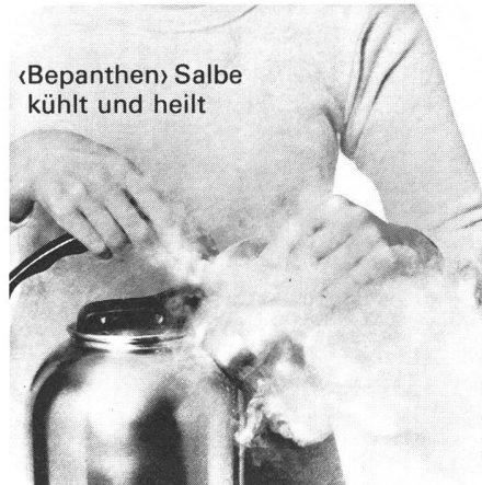
«Bepanthen» Salbe kühlt und heilt