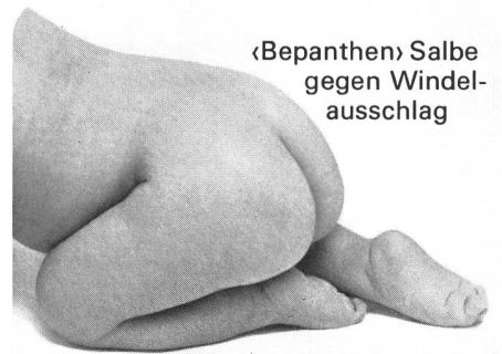
«Bepanthen» Salbe gegen Windel- ausschlag