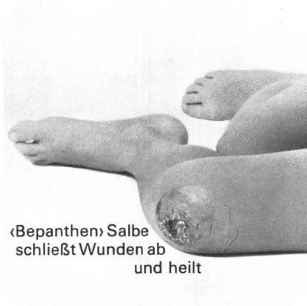
«Bepanthen» Salbe schließt Wunden ab und heilt