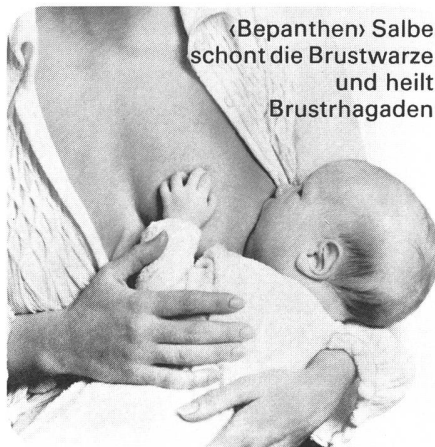
«Bepanthen» Salbe schont die Brustwarze und heilt Brustrhagaden