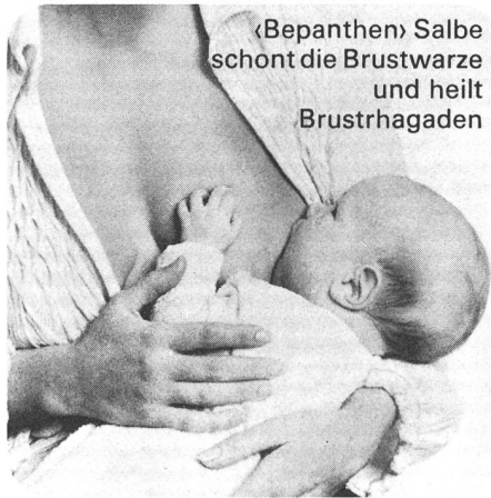
«Bepanthen» Salbe schönt die Brustwarze und heilt Brustthlagaden