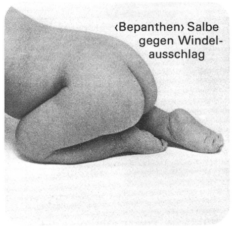
«Bepanthen» Salbe gegen Windel- ausschlag