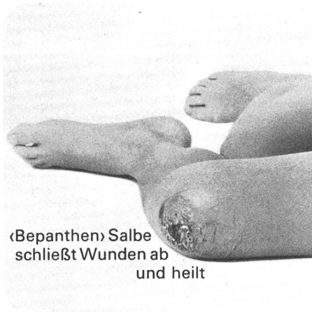
«Bepanthen» Salbe schließt Wunden ab und heilt