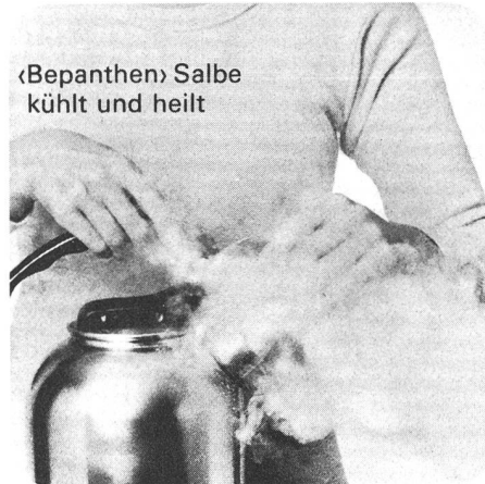
«Bepanthen» Salbe kühlt und heilt