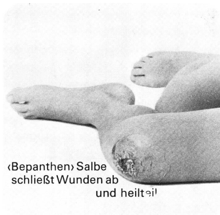
«Bepanthen» Salbe schließt Wunden ab und heilt eil