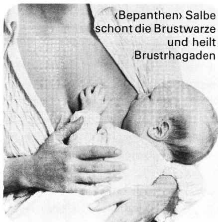
«Bepanthen» Salbe schont die Brustwarze und heilt Brustthgaden