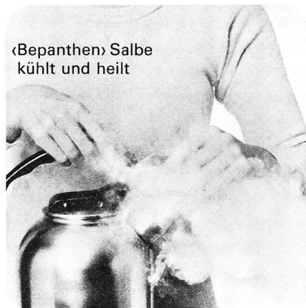
«Bepanthen» Salbe kühlt und heilt