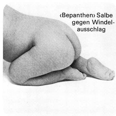
«Bepanthen» Salbe gegen Windel- ausschlag