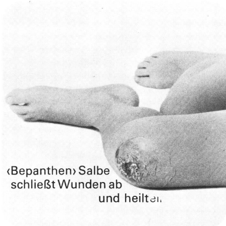
«Bepanthen» Salbe schließt Wunden ab und heilt.