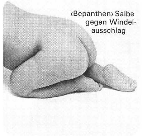
«Bepanthen» Salbe gegen Windel- ausschlag