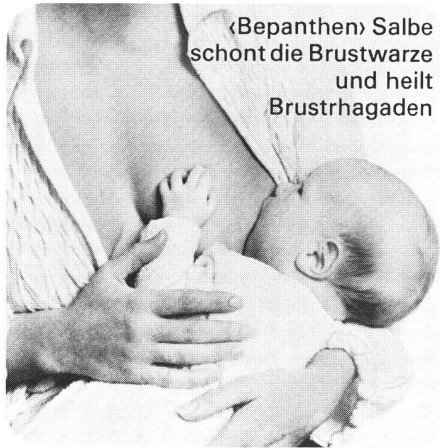
«Bepanthen» Salbe schont die Brustwarze und heilt Brustthlagaden