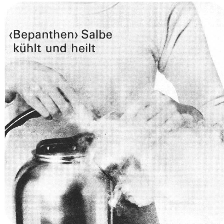
«Bepanthen» Salbe kühlt und heilt