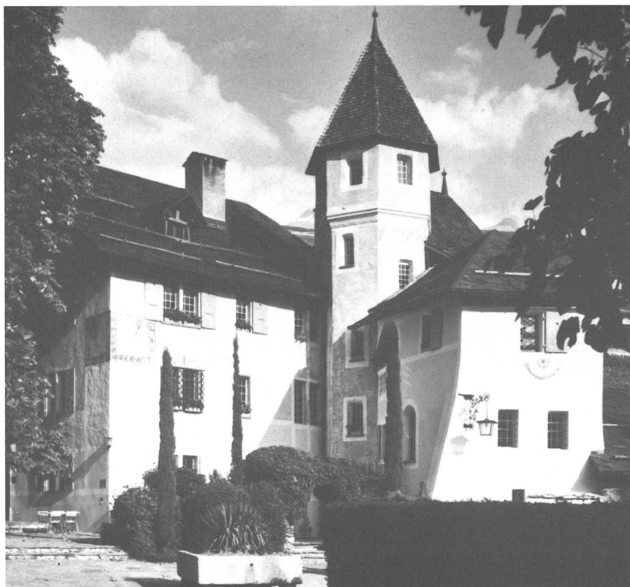
Château de Villa, Sierre.