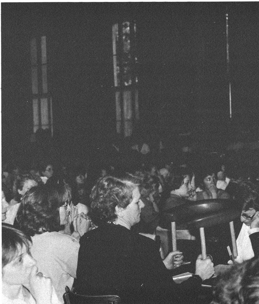
Analyse critique de la chaise d'accouchement

Paul Haupt AG, Falkenplatz 11, 3001 Bern