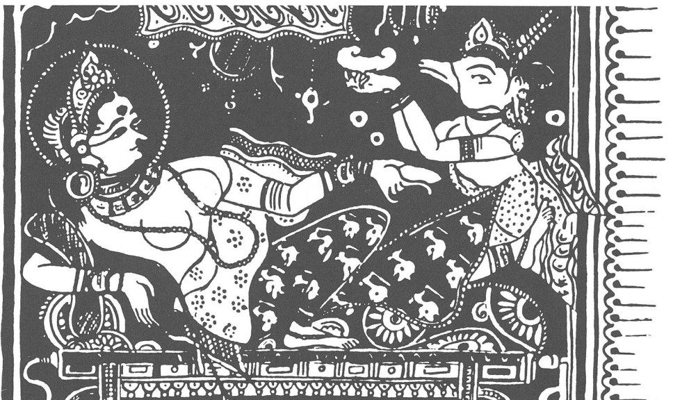
Shakra der Götterfürst gibt seinem göttlichen Boten den Auftrag, den Embryo des künftigen Glaubensstifters Mahavira in den Leib der Kriegerfrau Trishala zu übertragen.

Die Wunschvorstellung, den Zeugungsvorgang oder die Empfängnis zu beeinflussen, findet sich nicht nur in unserem Kulturraum, sondern auch ausserhalb Europas. Ein Beispiel, allerdings aus der indischen Mythologie stammend, soll anhand der nebenstehenden Abbildung aus dem 15. Jahrhundert erläutert werden: