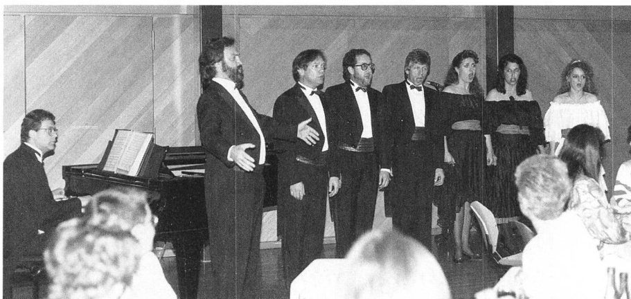
Unterhaltung beim Bankett: «La Cumpignia Rossini» Distraction pendant le banquet: «La Cumpignia Rossini»