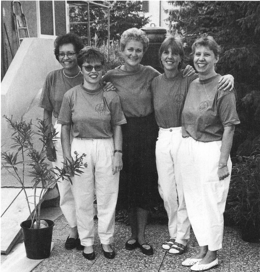
Die fünf Hebammen der «Geburtsstätte und Hebammengemeinschaft» in Muttenz feiern 1992 das zweijährige Bestehen ihres in Eigenregie geführten Geburtshauses.

daran, im Hebammenwesen endlich für Ruhe und Ordnung zu sorgen, denn unter den Binninger Hebammen herrschte um 1910 starke Konkurrenz, was auch hiess, dass die Frauen uneinig waren, wen sie als Hebamme wählen wollten. Für den Gemeinderat war es einfacher, wenn er selber entscheiden konnte.